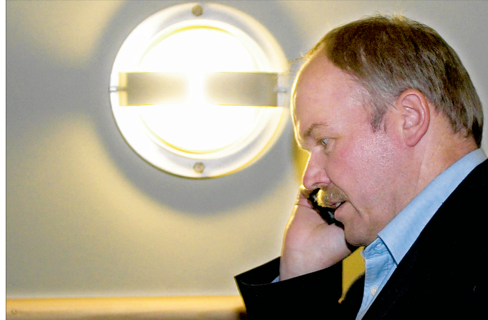
LOV Først var der en lov, så var den der ikke. Sagen om de hemmelige jobkarteller tog en uventet drejning, da Bent Bøgsted fra Dansk Folkeparti i sidste uge valgte at trække støtten til det lovforslag, regeringen havde fremsat.

Det er fagforeningernes skyld, at der ikke kommer et forbud mod de hemmelige jobkarteller. Sådan lyder det fra arbejdsmarkedsordfører Bent Bøgsted fra Dansk Folkeparti, der mener fagforeningerne bør tage det næste skridt i sagen